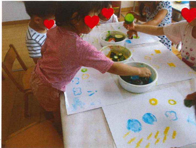
野菜スタンプをしました。 野菜の形っておもしろい！