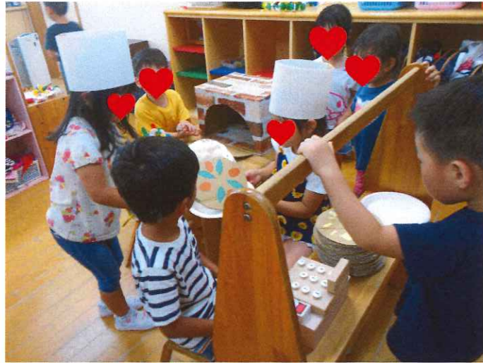
毎日大盛況のピザ屋さんです。 できたてのピザはいかがですか～！

梅雨が明けるといよいよ夏本番です。天気や気候の変化が大きい時期ですが、子どもたちは季節の移り変わりをじっくり楽しんでいます。引き続き感染症予防、体調管理、安全対策に十分気をつけながら、過ごしていきたいと思ひます。