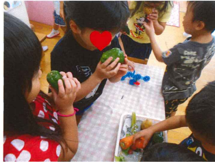
野菜を実際に触って匂いや触感を確かめました。 ピーマンはどんな匂いかな…？